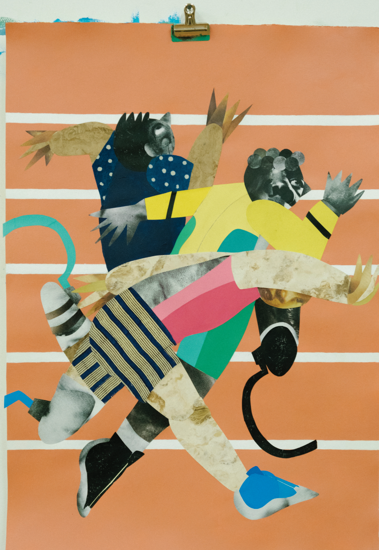
OBRA DE CLOTILDE JIMÉNEZ INSPIRADA EN EL ATLETISMO.